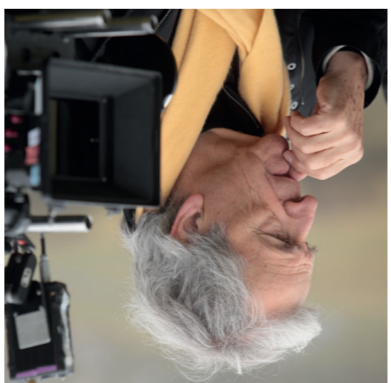
Président de la Cinématique française